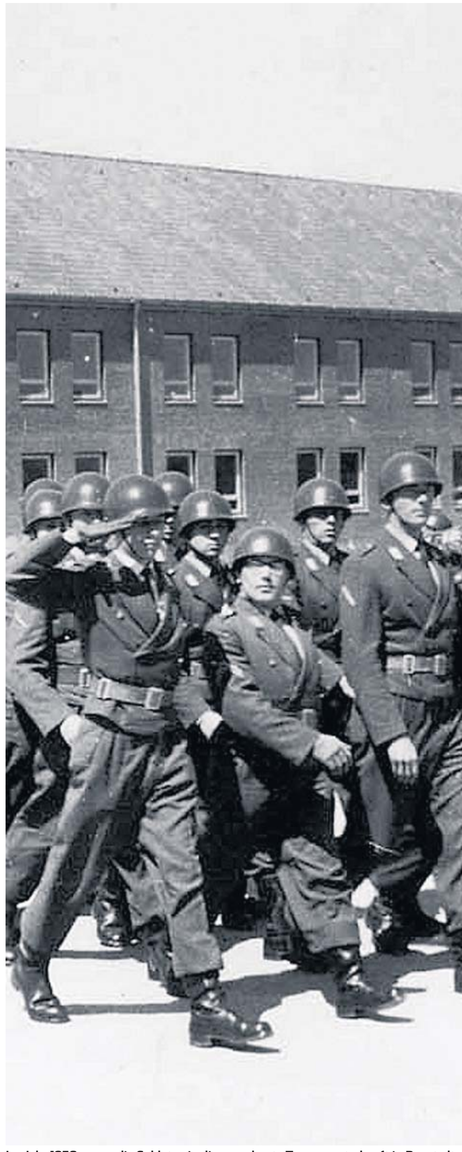
Im Jahr 1958 waren die Soldaten in die neuerbaute Truppenunterkunft in Boostedt eingezogen.

1900 Soldaten werden bis 2015 die Rantzau-Kaserne in Boostedt verlassen. Nur das Munitionsdepot bleibt bestehen